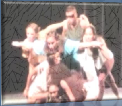
« Totem », G. BRAON A.E 2014