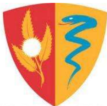
Ville de CHÂTENAY-MALABRY